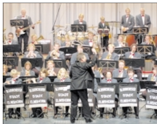
Das Blasorchester Stadt Elmshorn begeisterte im Saalbau sein Publikum mit einem ausgefeilten Programm.

Mehr als 300 Besucher beim Konzert des Blasorchesters Stadt Elmshorn im Saalbau am Adenauerdamm.